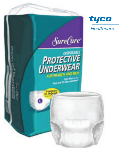
SOUS-VÊTEMENTS PROTECTEURS SURECARE