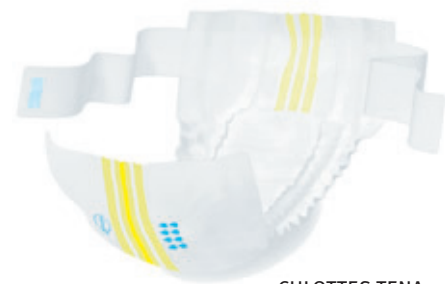
CULOTTES TENA FLEX-I-FIT MAXI