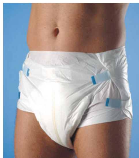
CULOTTES CLASSIC FIT