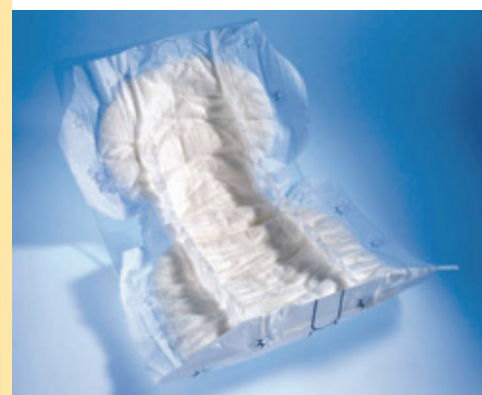
SERVIETTES SUPREME FORM