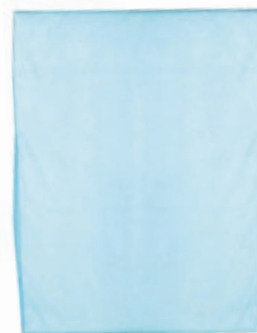
PROTÈGE-DRAPS DE LUXE JETABLE