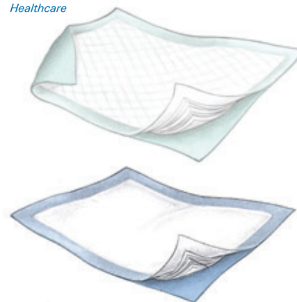
PROTÈGE-DRAPS DE TYCO