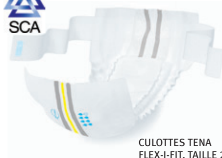
CULOTTES TENA FLEX-I-FIT, TAILLE 20