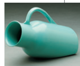
URINAL POUR HOMME