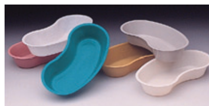
ÉCUELLES À VOMISSURE

Nous avons plusieurs centaines d'autres produits.