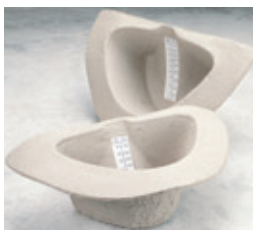
CONTENANT BIODÉGRADABLE POUR ÉCHANTILLON D'URINE