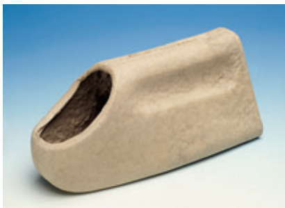
V20-020 URINAL BIODÉGRADABLE POUR FEMME