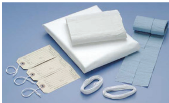
TROUSSE DE LINCEUL DE BUSSE