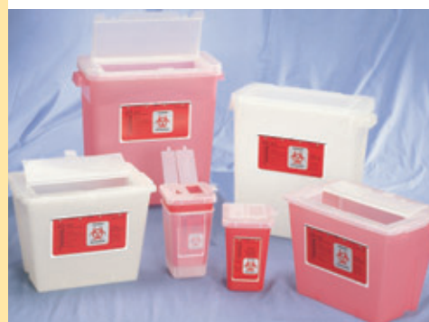
CONTENANTS POUR OBJETS POINTUS DE BEMIS